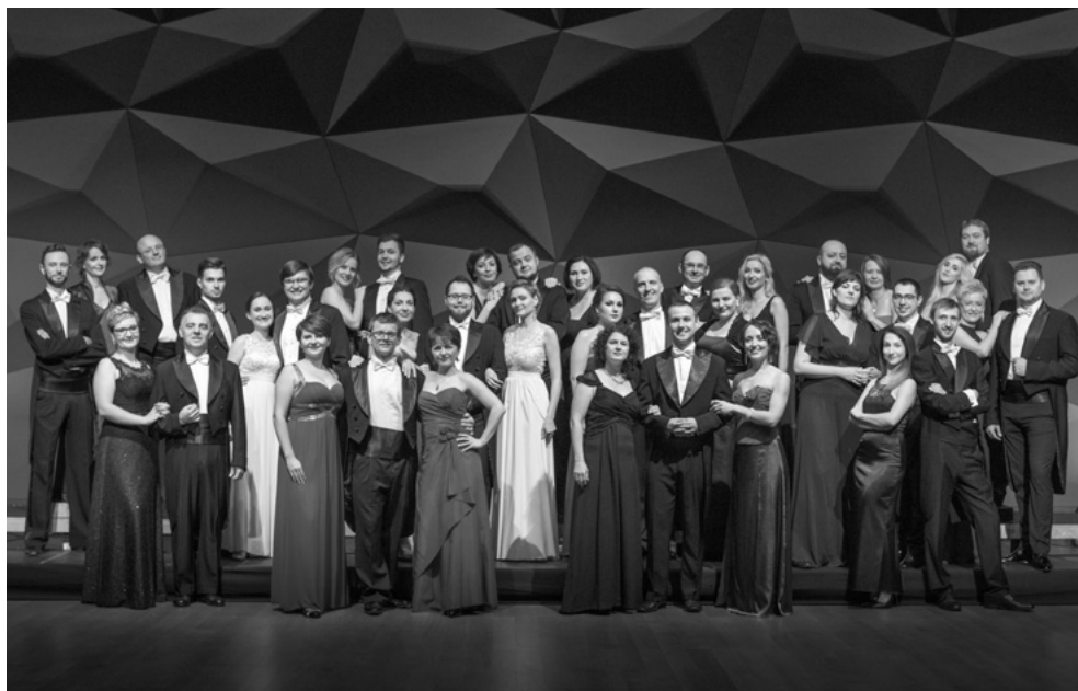
Chór NFM