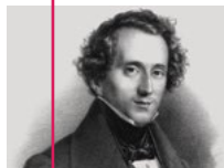
F. Mendelssohn Bartholdy