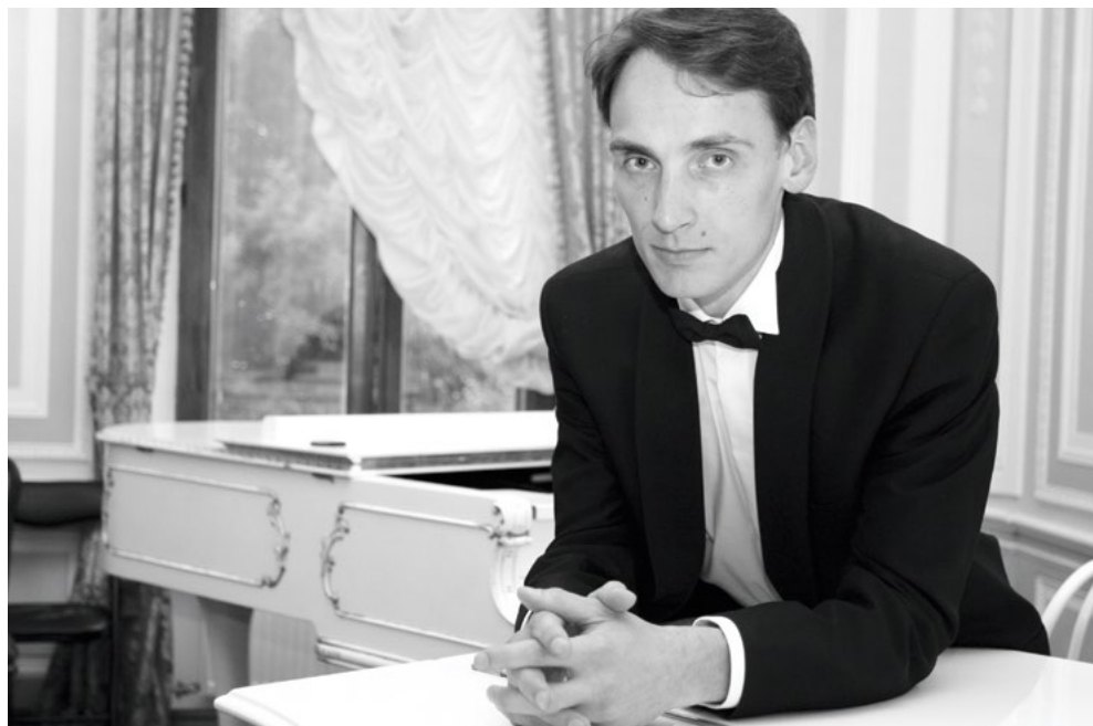
Alexey Komarov, fot. archiwum artysty