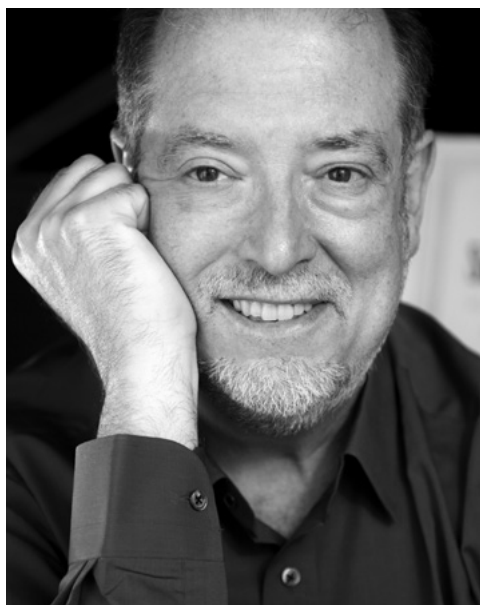
Garrick Ohlsson

Giancarlo Guerrero od sezonu 2017/2018 jest dyrektorem artystycznym NFM Filharmonii Wrocławskiej. Z orkiestrą tą zadebiutował w październiku 2016 r. Od 2009 r. jest dyrektorem muzycznym Nashville Symphony w Stanach Zjednoczonych. W tym okresie zespół odbył liczne trasy koncertowe i dokonał kilkunastu wyróżnionych nagrodami nagrań dla Naxos. Giancarlo Guerrero był również głównym dyrygentem gościnnym podczas rezydencji legendarnej Cleveland Orchestra w Miami. Regularnie