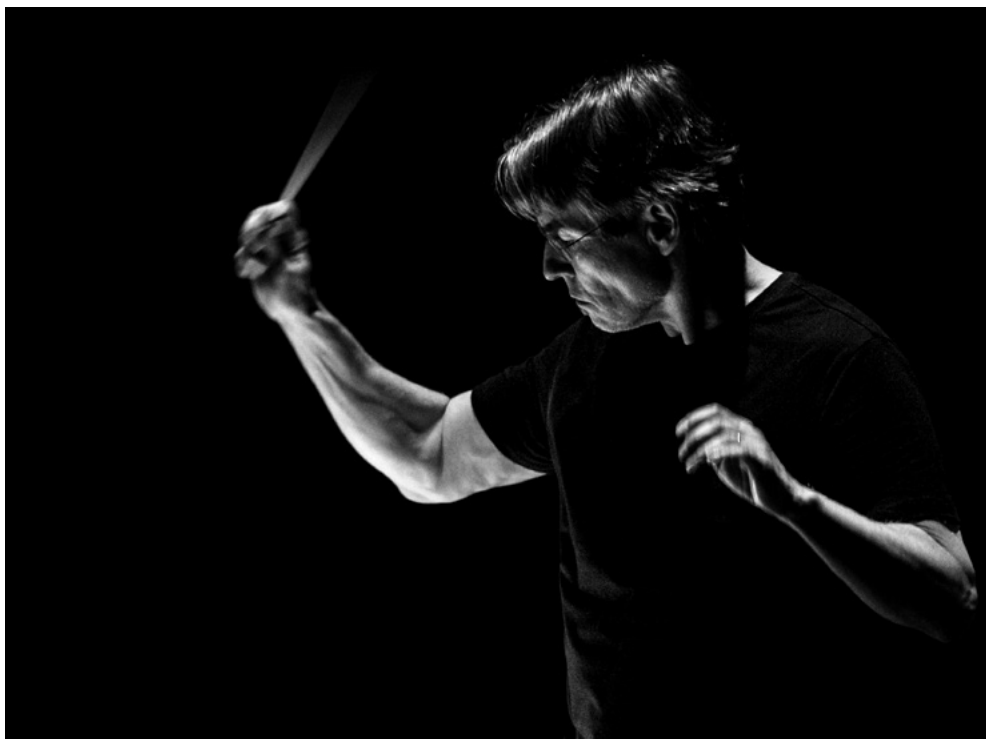
Esa-Pekka Salonen

całym świecie „wejść do orkiestry” poprzez projekcje audio i wideo. Salonen był również jednym z inicjatorów zaprojektowania bardzo popularnej aplikacji na iPada The Orchestra , która daje użytkownikowi dostęp do wewnętrznej struktury ośmiu dzieł symfonicznych. Jako dyrektor muzyczny Los Angeles Philharmonic (obecnie artysta jest dyrygentem honorowym tego zespołu) Salonen odegrał kluczową rolę w otwarciu zaprojektowanej przez F. Gehry’ego Walt Disney Concert Hall i uczynił tę orkiestrę jedną z najchętniej słuchanych i najlepiej finansowanych w kraju. Esa-Pekka Salonen pełni funkcję Marie-Josée Kravis Composer-in-Residence przy New York Philharmonic oraz Artist in Association przy Finnish National Opera and Ballet. Ponadto jest współzatożycielem i dyrektorem artystycznym organizowanego co roku od 15 lat Baltic Sea Festival. Niedawno został doradcą Sync Project, którego celem jest rozwój terapii poprzez muzykę. W 2015 r. wygłosił przemówienie na konferencji Apple Distinguished Educator na temat zastosowań technologii w edukacji muzycznej, a jego Koncert skrzypcowy znalazł się w międzynarodowej kampanii reklamowej iPada.