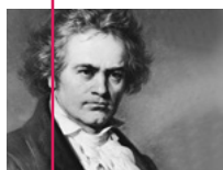
L. van Beethoven