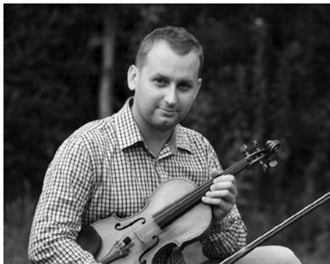
Paweł Maślanka

im. F. Nowowiejskiego oraz adiunktem w Akademii Sztuki w Szczecinie.