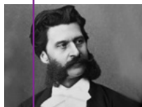
J. Strauss syn