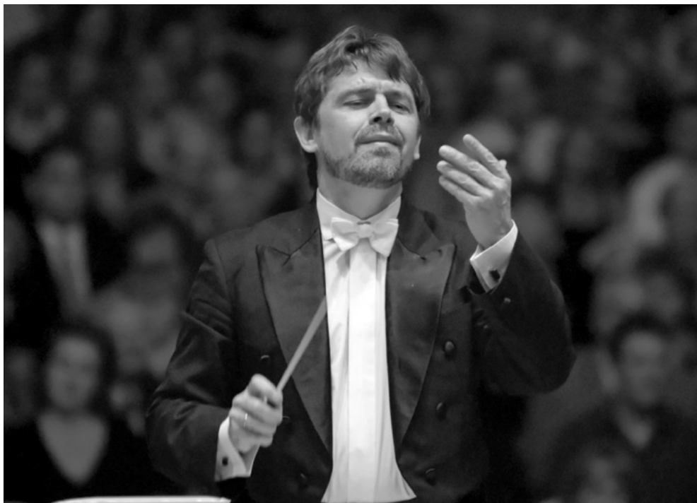
Andrzej Boreyko

o zasięgu krajowym i międzynarodowym, a tradycyjny repertuar równoważy innowacyjnym, różnorodnym programem oraz licznymi prawykonaniami dzieł takich kompozytorów, jak G. Kanczeli, F. Say, K. Meyer czy B. Mantovani. Artysta cieszy się dużą popularnością zarówno w Europie, jak i w Ameryce Północnej. W minionych latach wielokrotnie współpracował m.in. z New York Philharmonic, Chicago Symphony Orchestra, Philadelphia Orchestra, San Francisco Symphony, Los Angeles Philharmonic, Toronto Symphony Orchestra, Berliner Philharmoniker, Gewandhausorchester, London Symphony Orchestra, Orchestre Philharmonique de Radio France oraz Tonhalle Orchester Zürich. W sezonie 2015/2016 wraz z Los Angeles Philharmonic poprowadził długo oczekiwane, pierwsze amerykańskie wykonanie IV Symfonii H.M. Góreckiego. Zapis europejskiej premiery dzieła, dokonany z London Philharmonic Orchestra, ukazał się na płycie wydanej przez wytwórnię Nonesuch. Andrzej Boreyko prowadzi szeroką działalność nagraniową, m.in. wraz z SWR Sinfonieorchester realizuje projekt obejmujący wydanie na płytach kompletu symfonii D. Szostakowicza. Ostatni album z tej serii, na którym znalazła się VIII Symfonia , ukazał się w 2017 r.