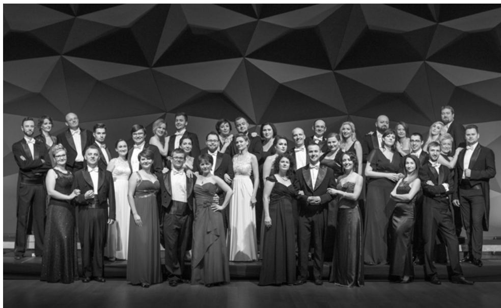
Chór NFM