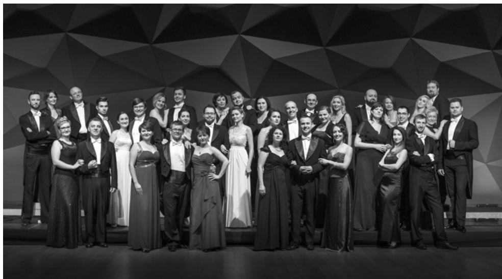
Chór NFM