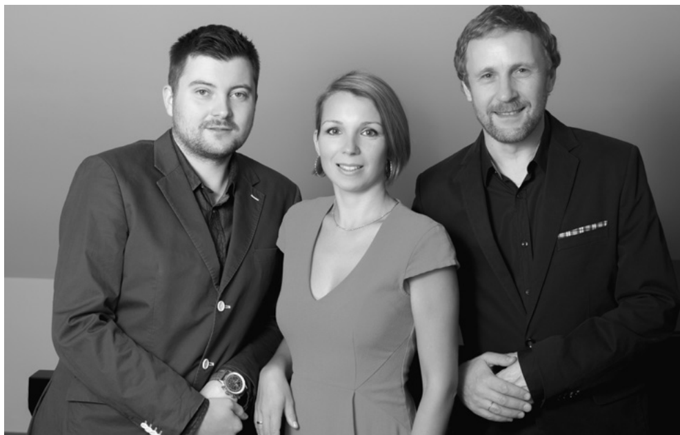
Łukasz Długosz, Agata Kielar-Długosz, Andrzej Jungiewicz, fot. archiwum artystów