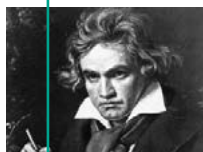
L. van Beethoven