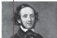
F. Mendelssohn Bartholdy