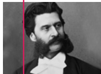
J. Strauss syn