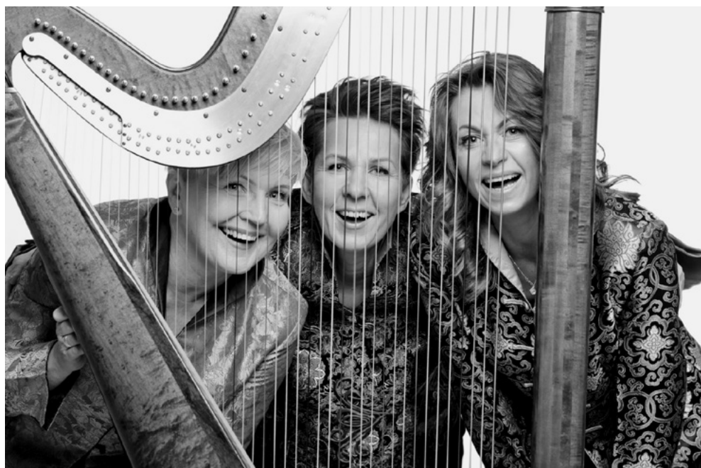
Artrio, fot. Łukasz Rajchert