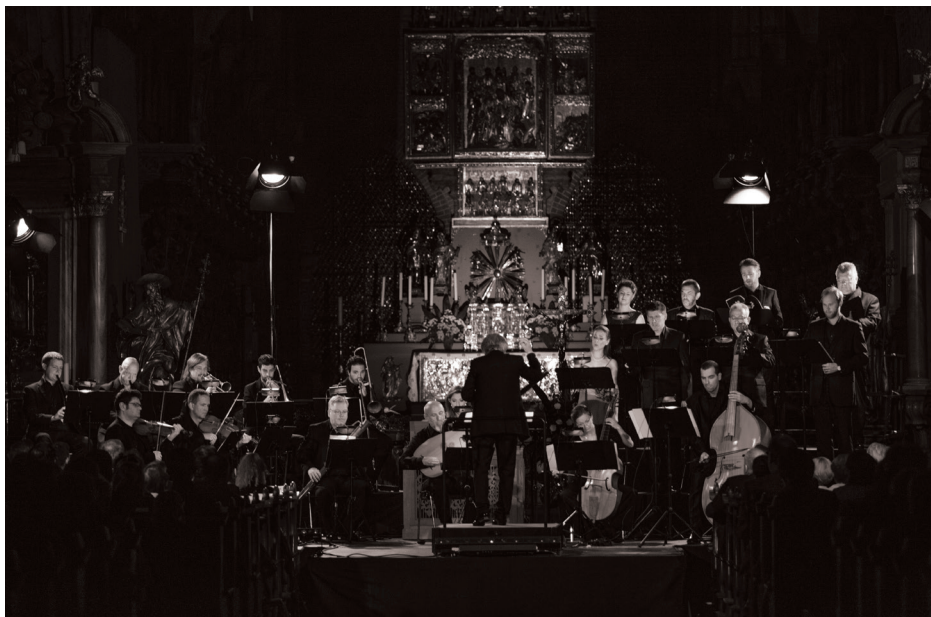
Wrocław Baroque Ensemble