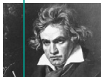
L. van Beethoven