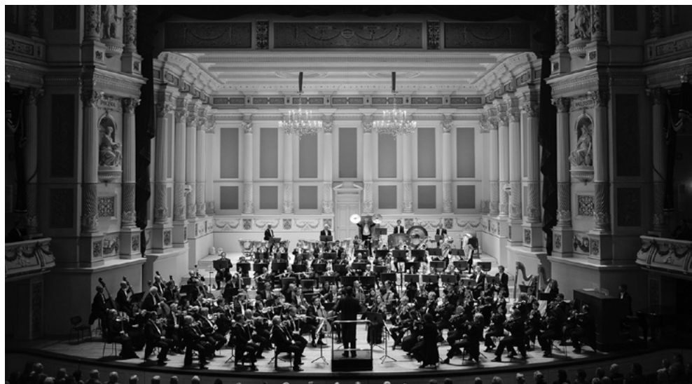
Sächsische Staatskapelle Dresden