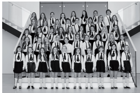
Chór „Con Brio”

Chór „Con Brio” Szkoły Muzycznej I st. im. G. Bacewicz we Wrocławiu powstał w 2002 r. Prowadzi ożywioną działalność artystyczną, koncertując w Polsce, Niemczech, Czechach i Finlandii. Zespół zdobył blisko trzydzieści nagród w licznych konkursach w całej Polsce. Dwukrotnie brał udział w spektaklach w ramach Przeglądu Piosenki Aktorskiej (2010, 2015). Współpracuje także z Narodowym Forum Muzyki we Wrocławiu. Kilkakrotnie wykonywał Pasję wg św. Mateusza i kantaty J.S. Bacha z Chórem NFM i Wrocławską Orkiestrą Barokową (Wrocław, Warszawa, Kalisz). Wielokrotnie uczestniczył w Międzynarodowym Festiwalu Wratlavia Cantans. Od 2009 r. regularnie występuje podczas kolejnych edycji Leo Festiwal z NFM Leopoldinum – Orkiestrą Kameralną. Chór „Con Brio” nagrał do tej pory dwie płyty CD: z utworami a cappella oraz z muzyką chóralną z towarzyszeniem zespołów szkolnych.