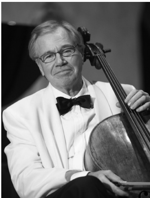
Arto Noras

Wybitny solista i kameralista. Jest założycielem i dyrektorem artystycznym festiwalu Naantali w Finlandii, a także przewodniczącym International Paulo Cello Competition, który założył w 1991 r. Jest solistą na Festiwalu Pablo Casalsa w Puerto Rico, a także na Festiwalu Pablo Casalsa w Prades. Koncertuje z najlepszymi orkiestrami na świecie. Artysta posiada szeroki repertuar – wykonuje m.in. utwory współczesnych kompozytorów, wśród których znajdują się te specjalnie mu dedykowane, jak np. The Nocturnal Dances of Don Juan Quixote A. Sallinen, IV Koncert wiolonczelowy L. Segerstama czy Koncert wiolonczelowy E. Bergmana. Dyskografia artysty zawiera nagrania z takimi orkiestrami, jak Radio Symphony Orchestra, Toronto Symphony Orchestra, Orkiestra Filharmonii Helsińskiej, Orkiestra Filharmonii Narodowej w Warszawie, z takimi dyrygentami, jak J.-P. Saraste, S. Oramo, M. Lehtinen, P. Berglund, Y.P. Tortelier i K. Penderecki. Arto Noras w 1964 r. ukończył studia pod kierunkiem Y. Selina w Akademii Sibeliusa, a dwa lata później został odznaczony drugą nagrodą w Międzynarodowym Konkursie im. P. Czajkowskiego, co otworzyło mu drogę do najważniejszych sal koncertowych na całym świecie.