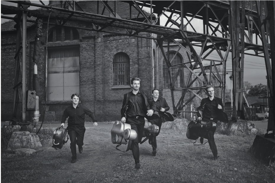
Polish Cello Quartet