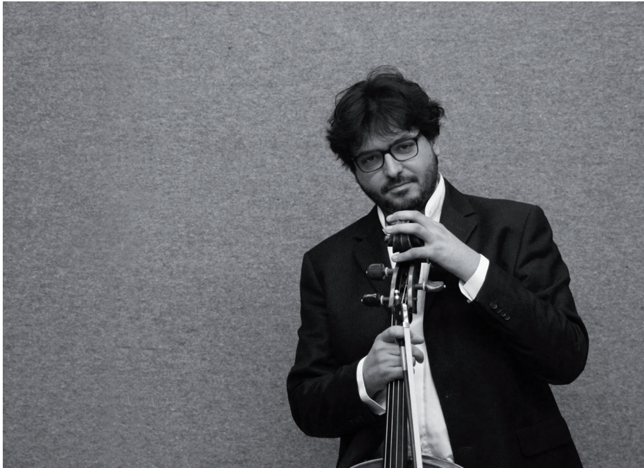
Roberto Trainini