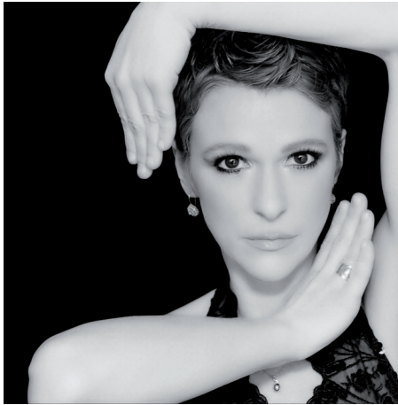
Jelena Očić