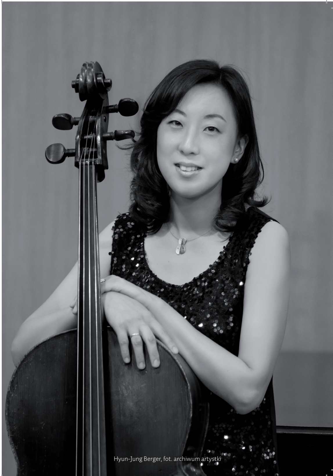
Hyun-Jung Berger