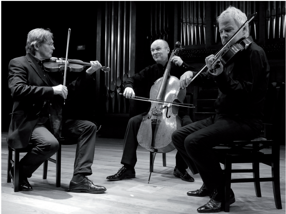
Zebra Trio