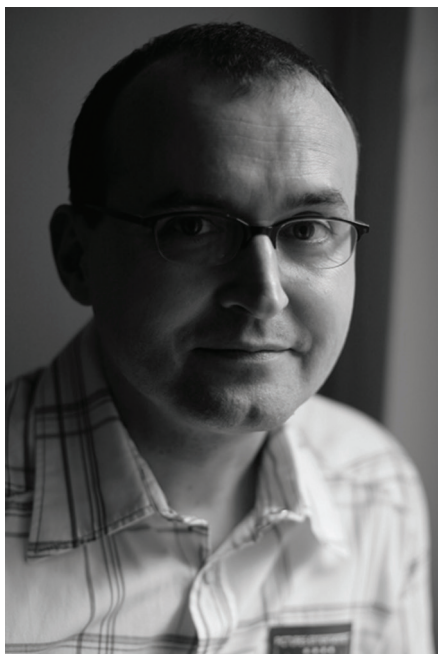
Ronald Šebesta