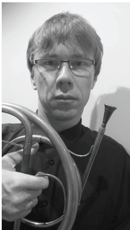
Marek Kuc