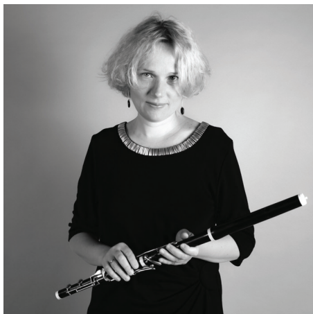
Magdalena Pilch