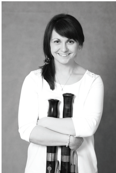
Elżbieta Jendrysik