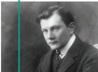
E. von Dohnányi