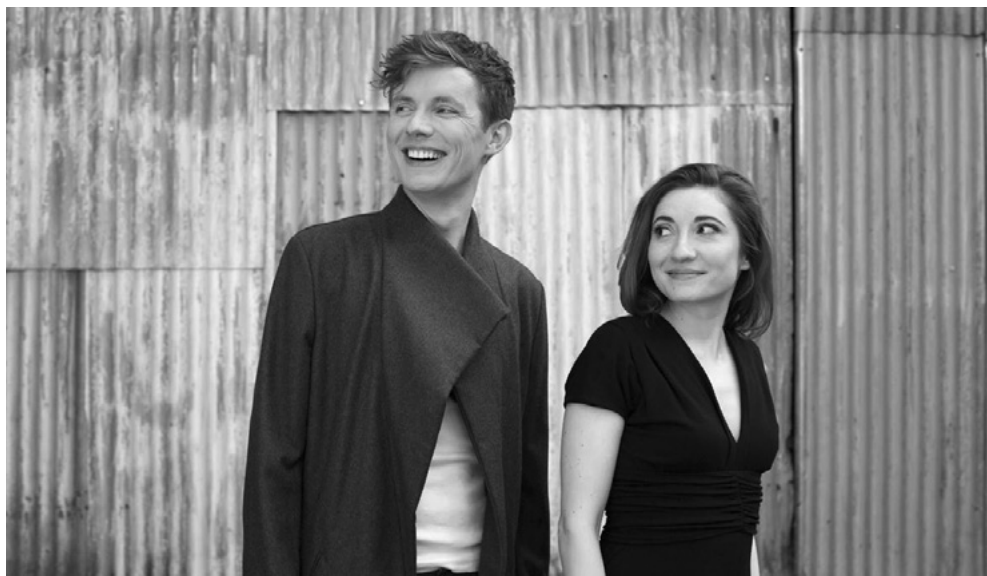
Lutostawski Piano Duo