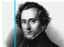
F. Mendelssohn Bartholdy

Projekt realizowany w ramach obchodów stulecia odzyskania niepodległości oraz odbudowy polskiej państwowości