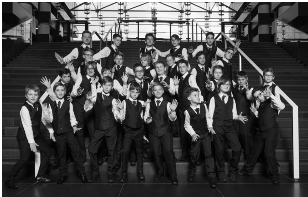
Chór Chtopięcym NFM

Jest absolwentką Akademii Muzycznej im. G. i K. Bacewiczów w Łodzi w klasie fortepianu. Od 2001 r. pracuje we wrocławskich szkołach muzycznych jako akompaniator i nauczyciel. Jej uczniowie zdobywają nagrody w licznych ogólnopolskich i międzynarodowych konkursach. Od 2009 r. współpracuje z Chórem Chtopięcym NFM. W 2010 r. otrzymała nagrodę indywidualną II stopnia przyznaną przez dyrektora Centrum Edukacji Artystycznej za szczególny wkład w rozwój edukacji artystycznej w Polsce. W wielu konkursach zdobywała nagrody za wyróżniający się akompaniament.