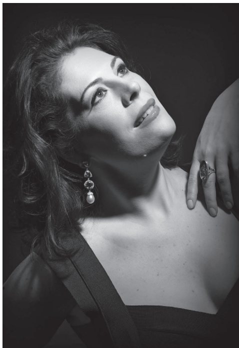
Sondra Radvanovsky

Światowej sławy artystka. Pod koniec lat 90. kształciła się w Metropolitan Opera w ramach Lindemann Young Artist Development Program. Uwagę krytyków zwróciła na siebie jako Antonia w Opowieściach Hoffmanna J. Offenbacha – dzięki tej roli zyskała popularność. Występowała we wszystkich większych teatrach operowych na świecie. Kreowała tytułowe partie w operach Aida i Luiza Miller G. Verdiego, występowała także jako Elvira w Ernanim , Elena w Nieszporach sycylijskich , Elżbieta w Don Carlosie , Amelia w Simonie Boccanegrze i Lina w operze Stiffelio tego kompozytora. Głęboka i subtelna barwa głosu artystki idzie w parze z jej zdolnościami aktorskimi i wszechstronnością repertuaru, który obejmuje m.in. tytułowe role w Rusalka A. Dvořáka, Lukrecji Borgii G. Donizettiego i Manon Lescaut G. Pucciniego oraz rolę Roxany w operze Cyrano de Bergerac F. Alfana. Jest powszechnie uznawana za jeden z czołowych współczesnych sopranów verdiowskich, a także jedną z najlepszych śpiewaczek bel canto .