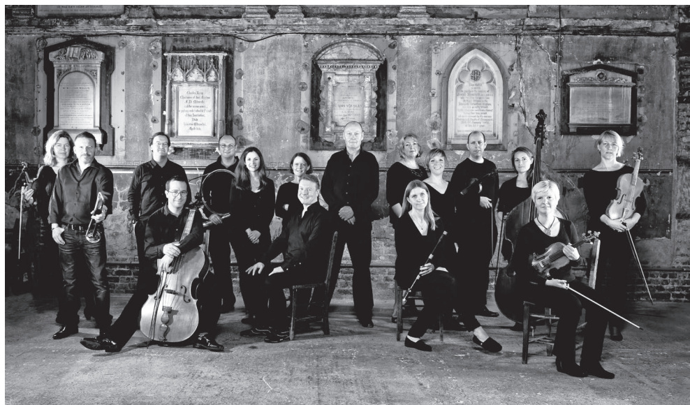
Gabrieli Consort & Players