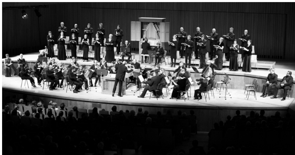
Capella Cracoviensis, fot. Tibor-Florestan Pluto