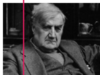
R. Vaughan Williams