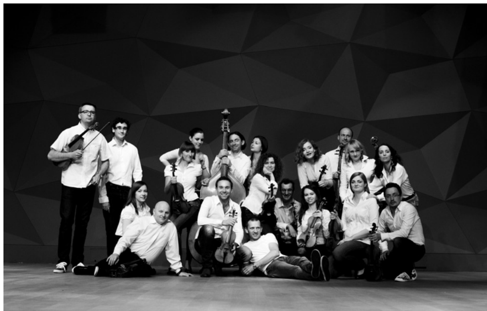
NFM Orkiestra Leopoldinum