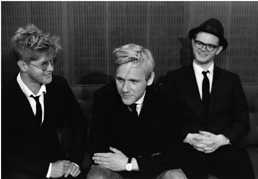
Dreamers' Circus, fot. archiwum zespołu

muzykę ludową w bardzo pomysłowy sposób. Jest całkowicie skoncentrowany na tym, by zaznajomić z nową muzyką nordycką jak najszerszą publiczność. Swój cel osiąga, dając liczne koncerty na całym świecie (w 2019 r. odbędzie się jego pierwsza trasa po Stanach Zjednoczonych) oraz nagrywając płyty – w 2017 r. ukazał się trzeci album zespołu, zatytułowany Rooftop Sessions .