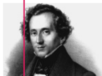
F. Mendelssohn Bartholdy