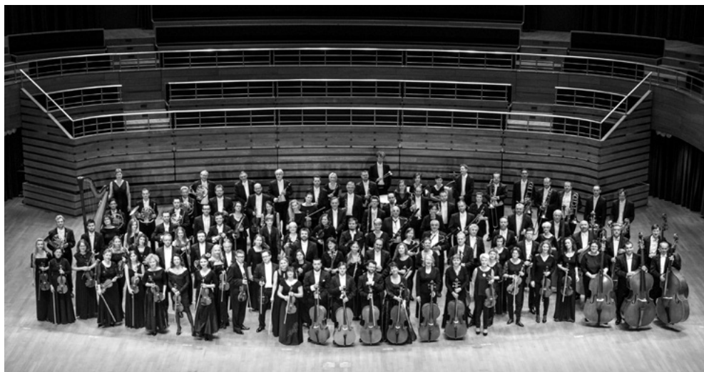
NFM Filharmonia Wrocławska