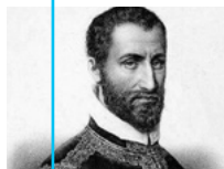
G.P. da Palestrina

POLSKA STULECIE ODZYSKANIA NIEPODLEGŁOŚCI