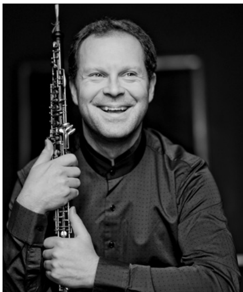
Alexei Ogrintchouk