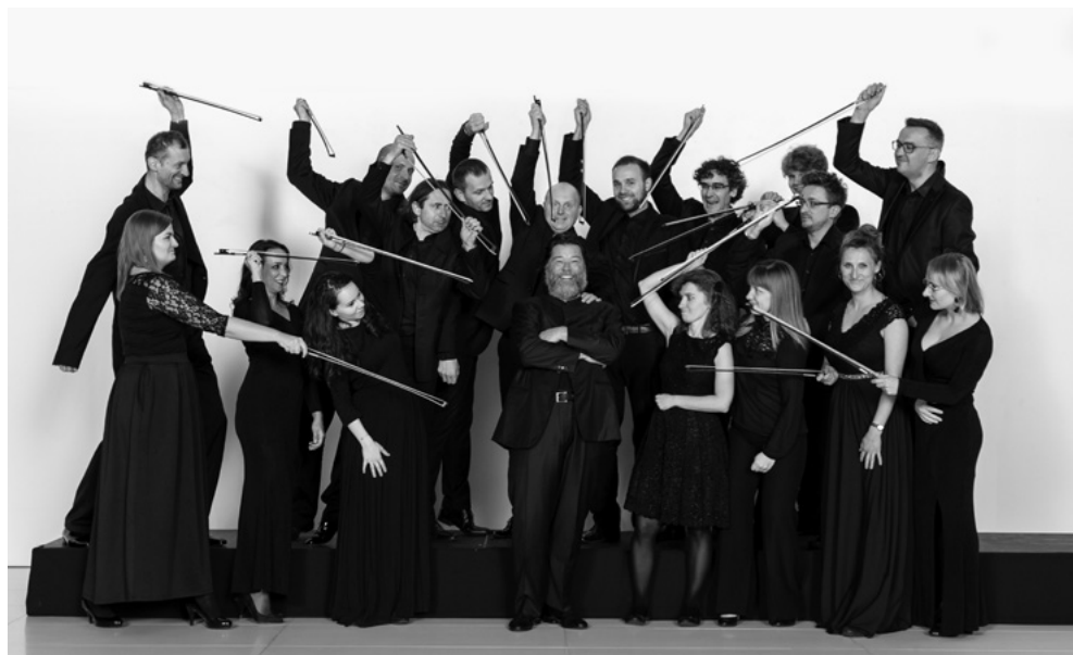
NFM Orkiestra Leopoldinum