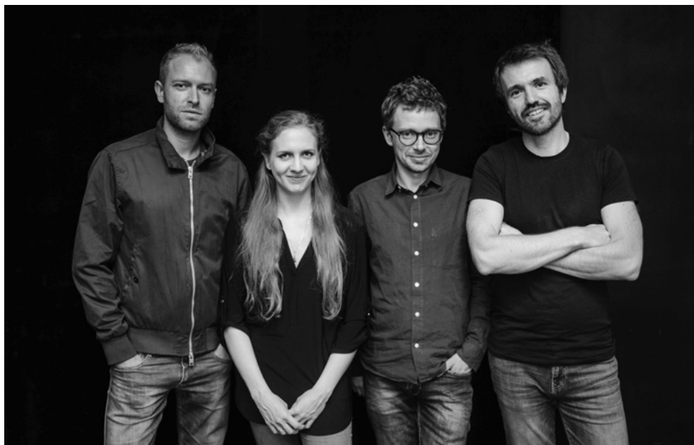
Lutoslawski Quartet