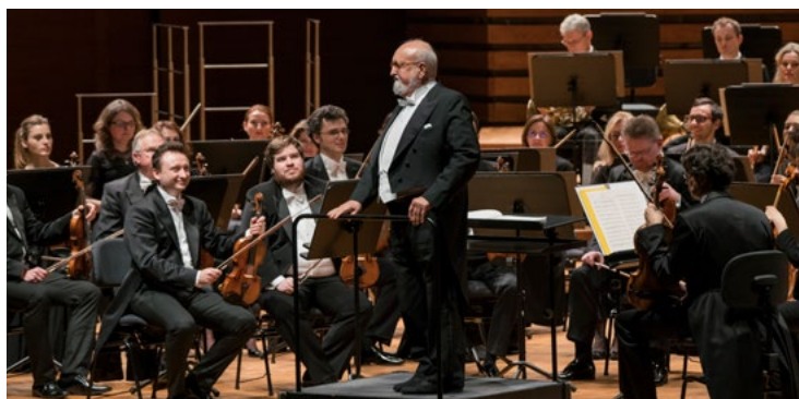
Krzysztof Penderecki i NFM Filharmonia Wrocławska, 2017 r.