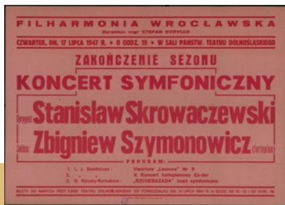
Afisz zapowiadający koncert pod batutą Stanisława Skrowaczewskiego, wierzący sezon artystyczny 1946/1947