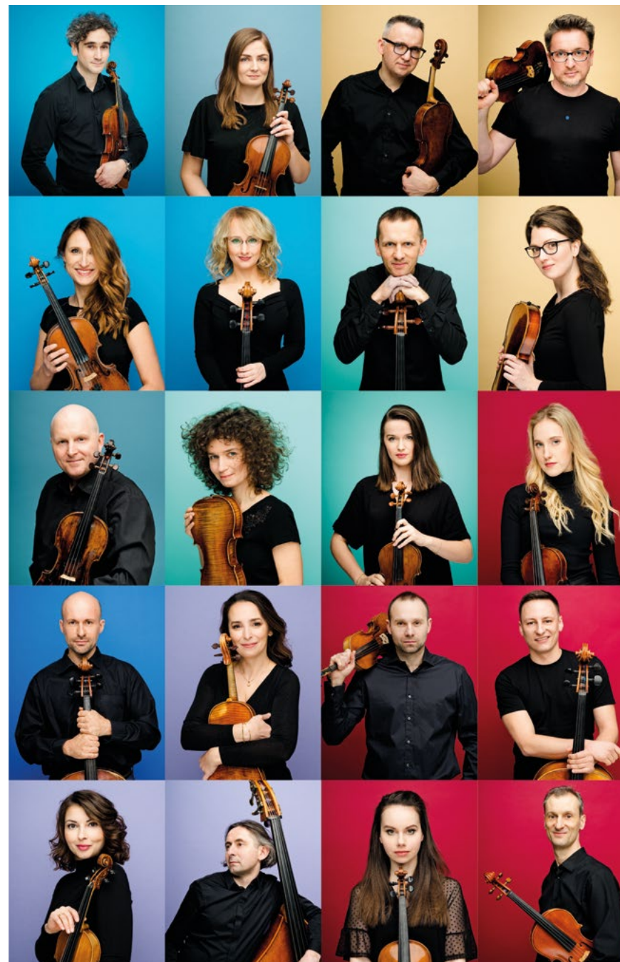
NFM Orkiestra Leopoldinum