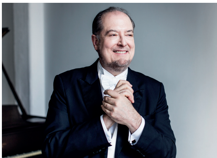
Garrick Ohlsson