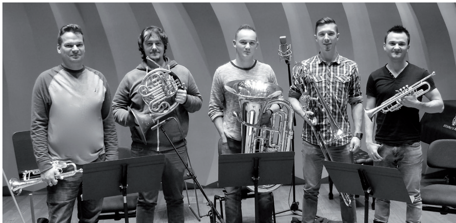
Polish Brass Quintet