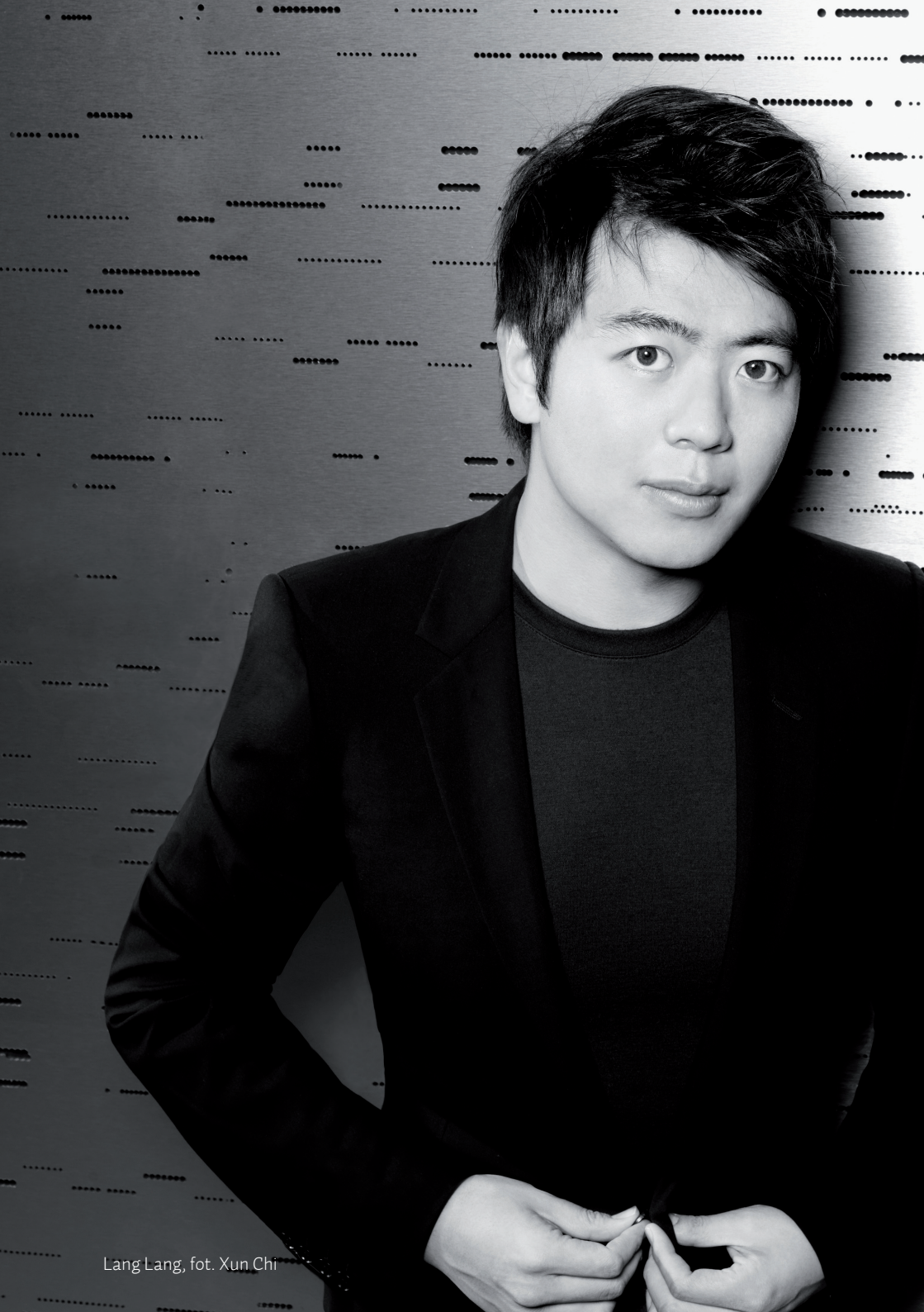
Lang Lang, fot. Xun Chi