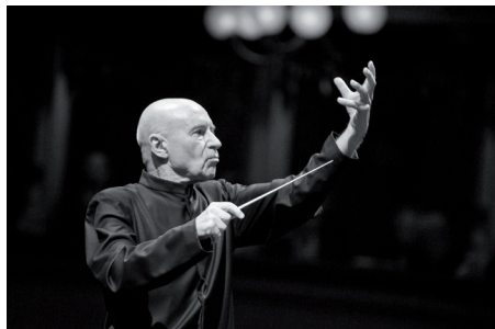
Christoph Eschenbach

myśl skojarzenie ze ścieżką dźwiękową z kreskówek Tom i Jerry , do których i Schönberg przyłożył rękę podczas swojego pobytu w Ameryce). W takich opracowaniach nie o ślepe naśladownictwo brzmienia i stylu jednak chodzi, ale o oryginalny, charakterystyczny podpis aranżującego kompozytora. W przypadku Arnolda Schönberga podpis to bardzo czytelny.