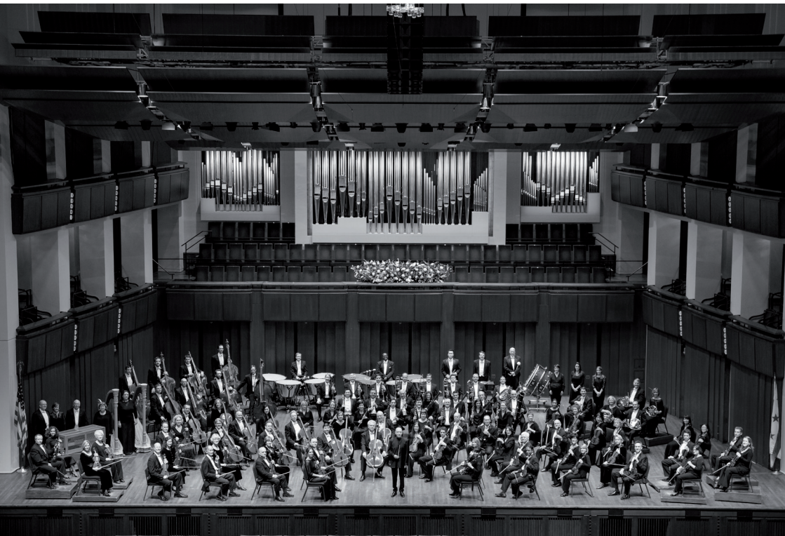
National Symphony Orchestra