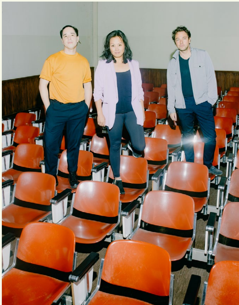
Sitkovetsky Trio, fot. Sophia Hegewald