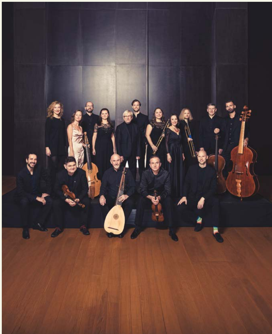
Wrocław Baroque Ensemble