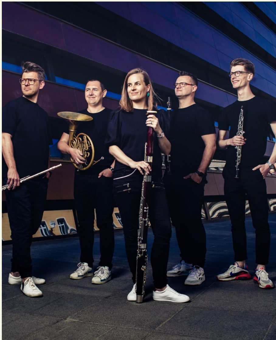
LutosAir Quintet